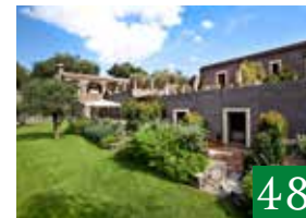
Casa La Carrubazza