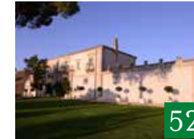
Castello Camemi Hotel Resort