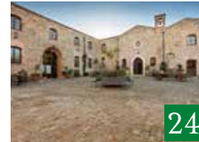
Abbazia Santa Anastasia