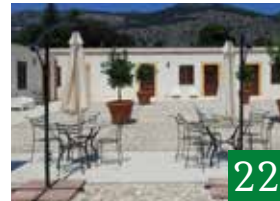
Villa Lampedusa Hotel & Residence