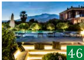
Zash Country Boutique Hotel