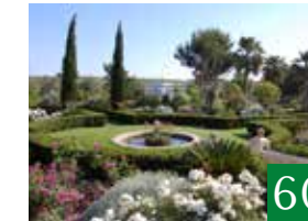
Commenda di San Calogero