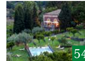
Monaci delle Terre Nere