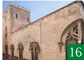
Palazzo Alliata di Pietratagliata