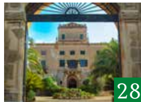
Castello San Marco