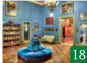
Palazzo Conte Federico