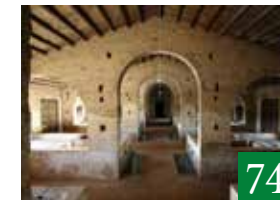
Wine Relais Feudi del Pisciotto