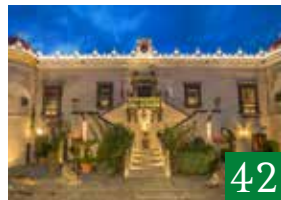
Castello di San Marco Charming Hotel & SPA